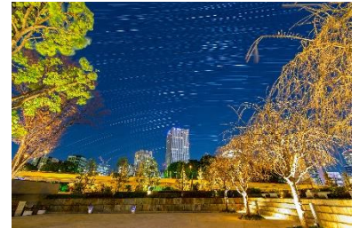
※画像は過去開催のもの

東京ガーデンテラス紀尾井町が位置する千代田区は、高層のオフィスビルが多く立ち並んでいます。感染症拡大防止のための行動制限が緩和されたことで、オフィスワーカーを中心に多くの人々が紀尾井町に戻ってきました。東京ガーデンテラス紀尾井町は、そんな紀尾井町で過ごす皆さんが日々の喧騒から離れ、星空を見あげながら何も考えない時間をつくることで心を整える。そんな癒やしの時間をこの夏、ご提供いたします。