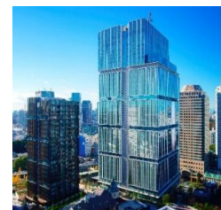
東京ガーデンテラス紀尾井町

歴史がもたらす品格と。未来へ向かう広い視野と。訪れ、働き、暮らす一人ひとりを包む、穏やかな空気と。それらが合わさることで生まれるあたらしい価値を、私たちは東京の中心から、皆様にお届けしてまいります。