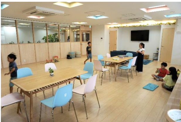
<アフタースクール>