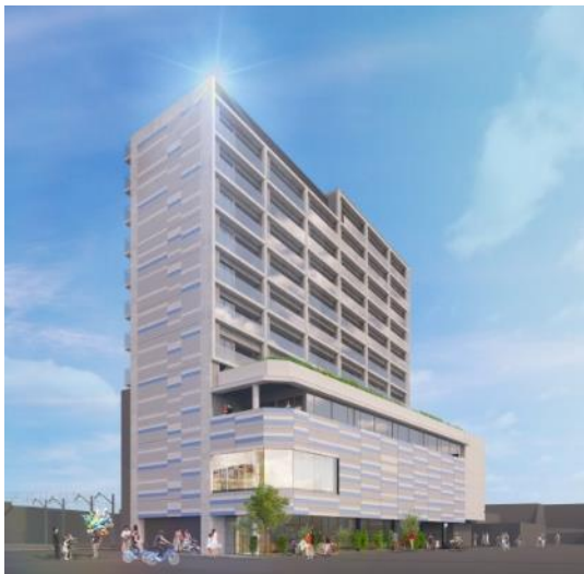
「エミライブ東長崎」外観