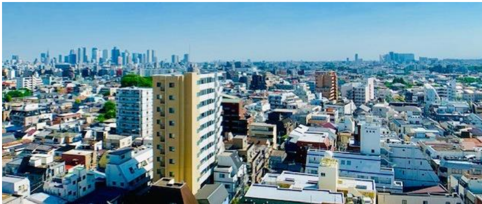
「エミライブ東長崎」高層階からの眺望

物件(募集)ホームページ▶ http://www.emilive.jp/higashi-nagasaki/ ※公開は6月28日(金)予定