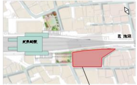
「エミライブ東長崎」