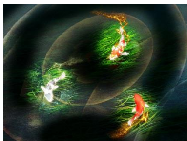
＜水景マッピング イメージ画像＞