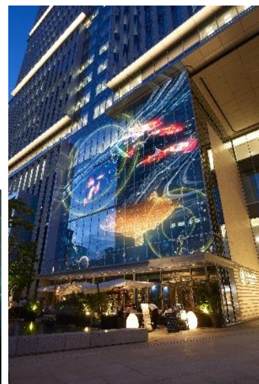
＜壁面マッピング イメージ画像＞