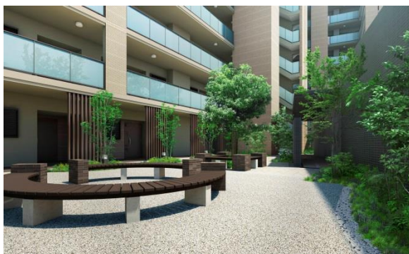
外部から敷地内へとアプローチする中庭空間