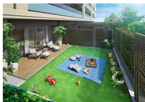
1階住居には専用庭を設置