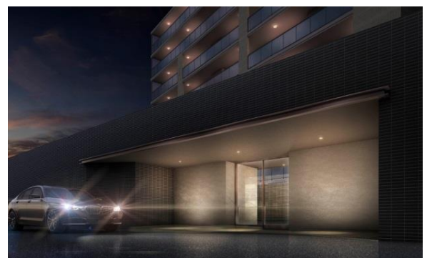
車寄せのあるコーチエントランス