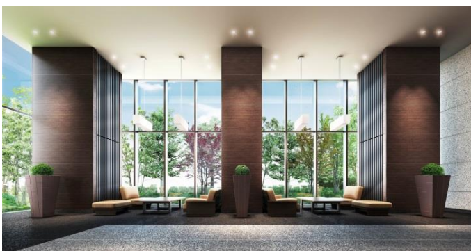
約 4.5mの天井高を誇る吹き抜けのラウンジ