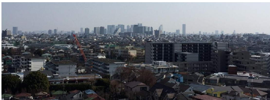
「エミライブ驚ノ宮」高層階からの眺望