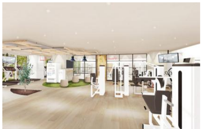
西武フィットネス emifit(エミフィット)鷺ノ宮 内観イメージ