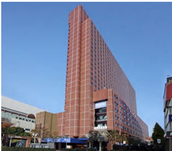
西武新宿ビル外観