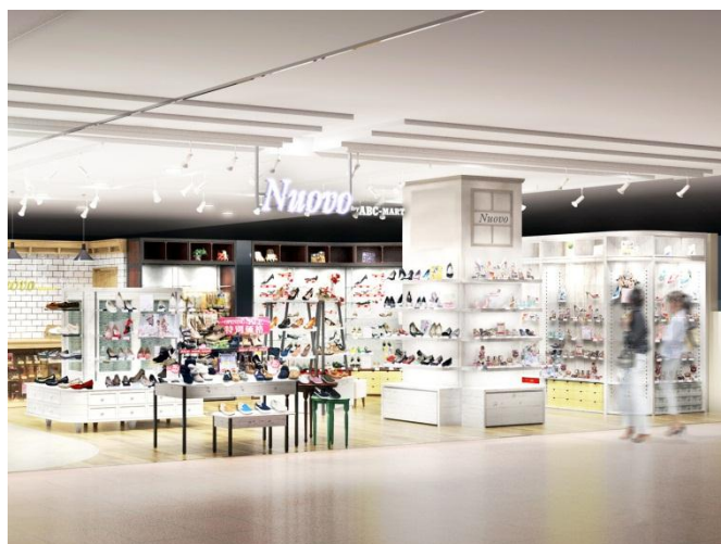
ヌオーヴォ バイエービーシー・マート (イメージ)