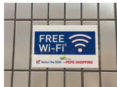
無料公衆無線 LAN の施設内ご案内表示

2015年10月に1階・2階に無料公衆無線 LAN (Wi-Fi) サービスを 導入しました。