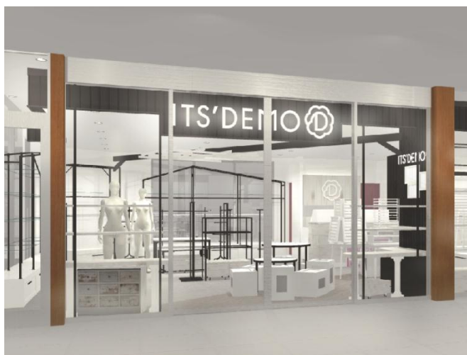
イツデモ (イメージ)

4月5日(火)から4月10日(日)には、“桜*満開宣言”をテーマに「夢咲フェスタ」を開催、リニューアルオープニングセールやオープニング記念品プレゼントなどのリニューアルイベントを実施いたします。