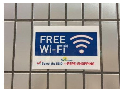
無料公衆無線 LAN の施設内ご案内表示

2015年10月に1階・2階に無料公衆無線 LAN (Wi-Fi) サービスを導入しました。