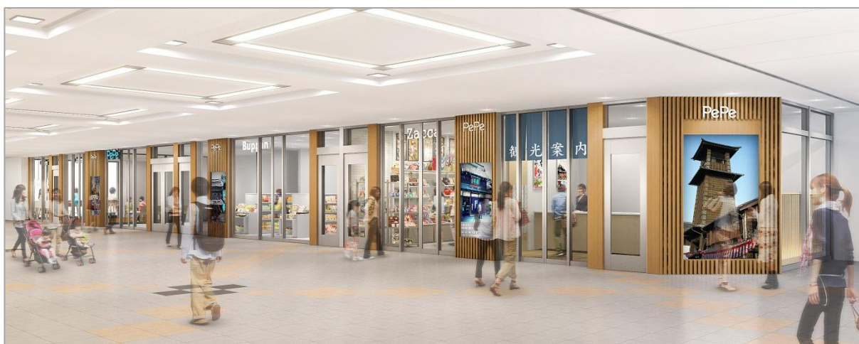
本川越駅改札前コンコース前から見た売場増床部分とデジタルサイネージのイメージ

また、併せて3階におきましては、一部店舗の入替えを行い、更なる利便性の高い商業施設を目指します。